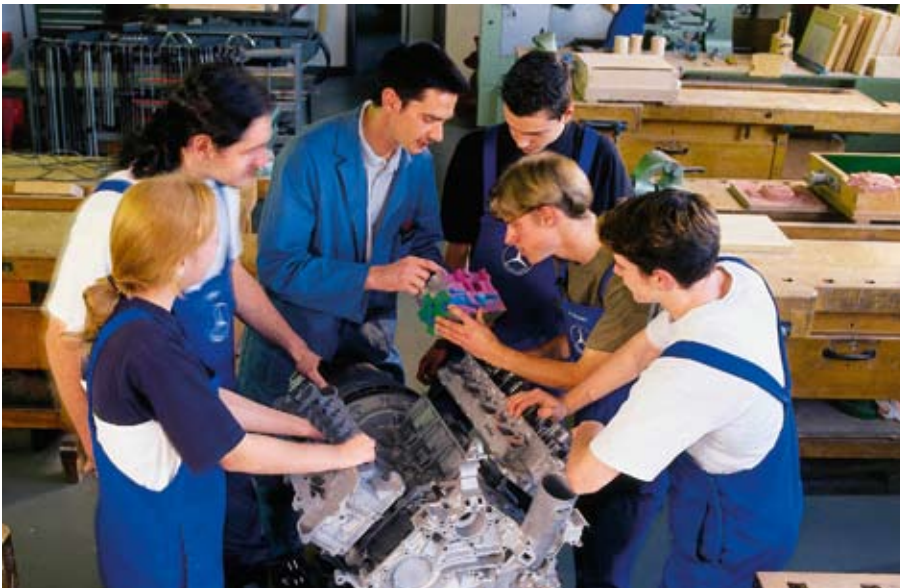
Berufsausbildung für's Leben: AIDS-Aufklärung wird integriert

kenden Produktivität konfrontiert. DaimlerChrysler hat diese Entwicklung mit seinem Arbeitsplatzprogramm abbremsen können. Nicht nur die Fehlzeiten, sondern auch die dauerhafte Arbeitsunfähigkeit in Folge von HIV/AIDS sind signifikant zurückgegangen.