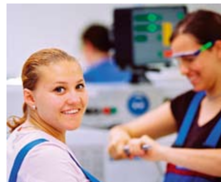
Auszubildende bei DaimlerChrysler

Mit seinem Arbeitsplatzprogramm zielt das Industrieunternehmen natürlich nicht nur auf eine Verringerung der individuellen menschlichen Tragödien, es will auch die Produktivität seines Standortes sicherstellen. In Südafrika, dem Land mit den meisten HIV-Infizierten weltweit (5,5 Millionen Menschen), ist die Immunschwächekrankheit längst zu einem volkswirtschaftlichen Problem geworden, von dem auch ausländische Unternehmen betroffen sind, die in Südafrika