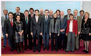
Die Mitglieder des nationalen AIDS-Beirates

Der Nationale AIDS-Beirat besteht seit 1987. Als Beratungsgremium des Bundesministeriums für Gesundheit begleitet er die Weiterentwicklung der HIV/AIDS-Strategie mit fachlichem Rat. Die personelle Besetzung des Beirates spiegelt die Vielfalt und Komplexität seiner Aufgabenstellung wider. Er ist interdisziplinär mit Expertinnen und Experten aus den Bereichen Forschung, medizinische Versorgung, öffentlicher Gesundheitsdienst, Ethik, Recht, Sozialwissenschaften, sowie Personen aus der Zivilgesellschaft einschließlich der Selbsthilfe besetzt. Menschen mit HIV sind nicht ausreichend vertreten, kritisieren die Deutsche AIDS-Hilfe und die Internet-Plattform www.ondamaris.de .