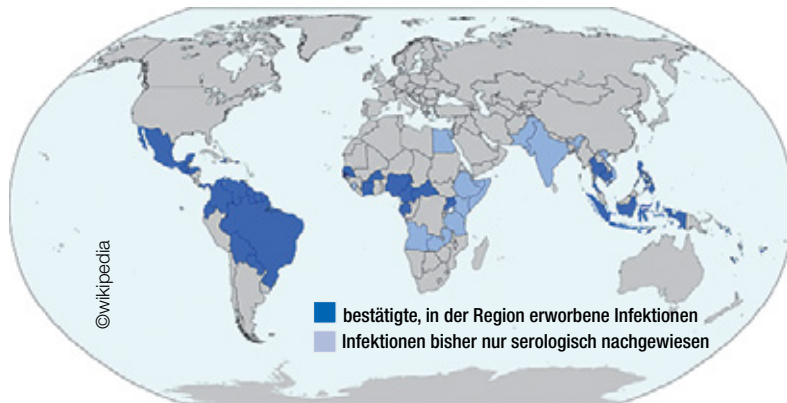
Länder, in denen Zika-Virus-Infektionen durch Stechmücken-Übertragung in der Vergangenheit aufgetreten sind (Stand: Januar 2016).

Aktuell breitet sich das Virus in Mittel- und Südamerika aus. Aktuelle Karten stellen die Weltgesundheitsorganisation (WHO) und das Europäische Zentrum für die Prävention und Kontrolle von Krankheiten (ECDC) zur Verfügung. Überträger von Zika sind Stechmücken der Gattung Aedes – in bisher bekannten Ausbrüchen vor allem die Gelbfiebermücke Aedes aegypti, die in weiten Teilen der Tropen und teilweise auch in den Subtropen verbreitet ist. Allerdings gelten auch die in gemäßigten Breiten vorkommenden Asiatischen Tigermücken Aedes albopictus als Übertragungskompetent.