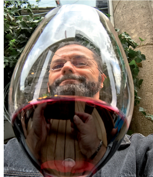
Auch Genussmittel (in Maßen!) können das Alter erträglicher machen - meint der Autor dieses Beitrags

Menschen mit HIV unterscheiden sich von Menschen ohne HIV in mehr Dingen als eben nur HIV. Glaubt man den soziologischen Daten, so führen Menschen mit HIV (Leser dieses Artikels sind natürlich ausgenommen) im Durchschnitt ein etwas genussbetonteres und risikofreudigeres Leben als die Allgemeinbevölkerung. Auf gut Deutsch: Mehr Sex, mehr Drugs, mehr Rock'n Roll. Das soll auch gar nicht wertend sein, aber