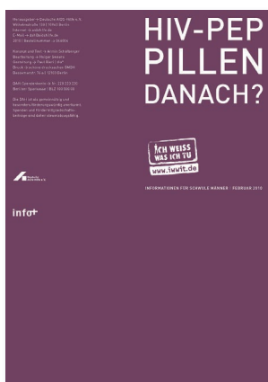
Flyer der Deutschen Aidshilfe von 2010

Verletzung an HIV-kontaminierten Instrumenten bzw. Injektionsbestecken, Benetzung von offenen Wunden und Schleimhäuten mit HIV-kontaminierten Flüssigkeiten,