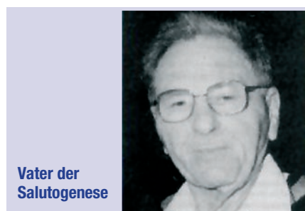
Vater der Salutogenese