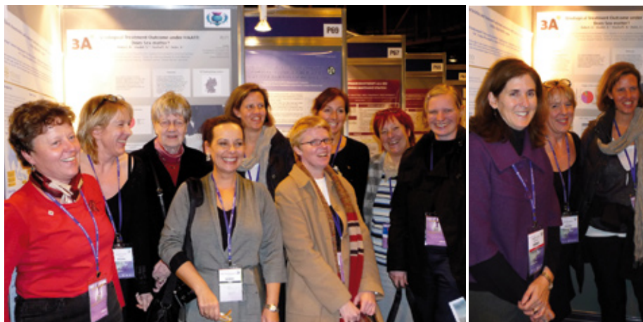
Abb. links: Nach dem Vortrag – Spontanes Treffen am 3A-Poster; Abb. rechts: Chairwoman Judith Currier besucht das 3A-Poster

Ein Problem wurde in Glasgow noch einmal überdeutlich: In Ländern, in denen der Anteil HIV-positiver Frauen relativ gering ist, werden sie mit ihren Belangen nicht adäquat berücksichtigt. Verstärkt wird dieser Effekt sicherlich dadurch, dass die Meinungsbildner im HIV-Bereich, überwiegend männlich sind. Das hat verständlicherweise Einfluss auf Forschungsschwerpunkte, Studienkonzepte und Therapieempfeh-