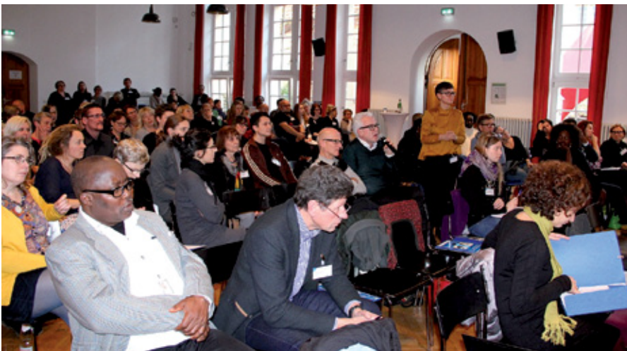
Plenum im Saal des GLS Campus in Berlin