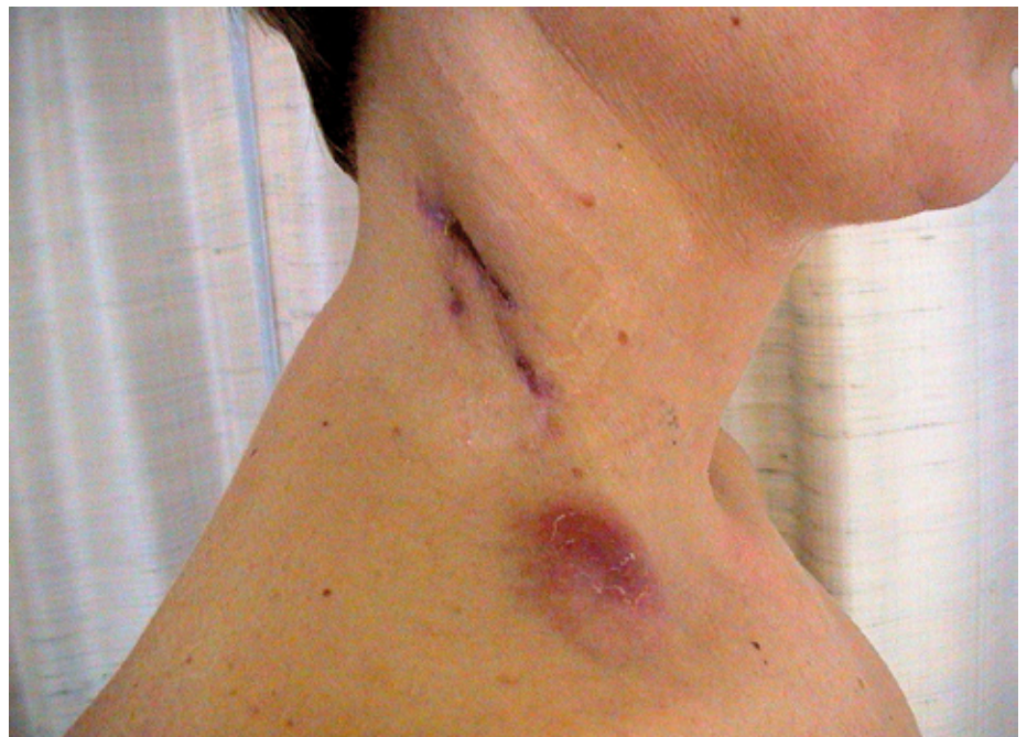
Abb. 2: Zustand nach MAC-Befall der Halslymphknoten