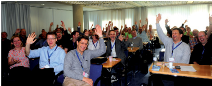
Abstimmung bei guter Stimmung auf der DAIG-MV in Innsbruck