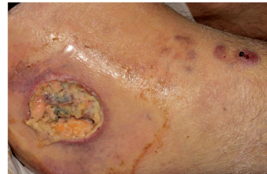
Abb. 1 Lokalbefund zum Diagnosezeitpunkt des T-Zelllymphoms. Schmerzhafte nekrotisierende Ulzeration am rechten Oberschenkel

Bei den kurativen Therapiestrategien, die auf die Beeinflussung der Interaktion von HIV und dem CCR5-Rezeptor abzielen, kann zudem die Variabilität von HIV einen langfristigen Erfolg verhindern, wie es bei dem „Essen Patienten“ beobachtet wurde. 3 Ein HIV positiver Late-Prezenter im AIDS-Vollbild bei dem ein T-Zelllymphom diagnostiziert wurde (Abb. 1), das auf konventionelle Chemotherapie nicht bzw. nur partiell angespro-