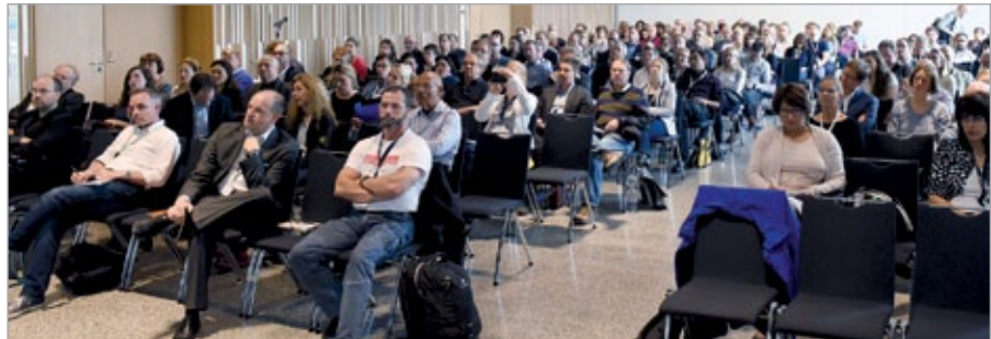
25 Jahre DAIG: Jubiläumssymposium

Bis heute hat die DAIG acht deutsche und gemeinsam mit der Österreichischen AIDS-Gesellschaft sechs Deutsch-Österreichische Kongresse durchgeführt. 2009 fand der bislang einzige Schweiz-Österreichisch-Deutsche AIDS-Kongress (SÖDAK) statt. – Im Rahmen des DAIG-Jubiläumssymposium wurde in Würzburg auch der 1. Posterpreis der Sektion